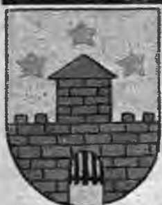
SENĀS BANDAVAS TIRDZNICĪBAS CENTRS

Aizputes pils ir viena no retajām ordeņa laika piliņiem, kas vēl tagad apdzīvota.