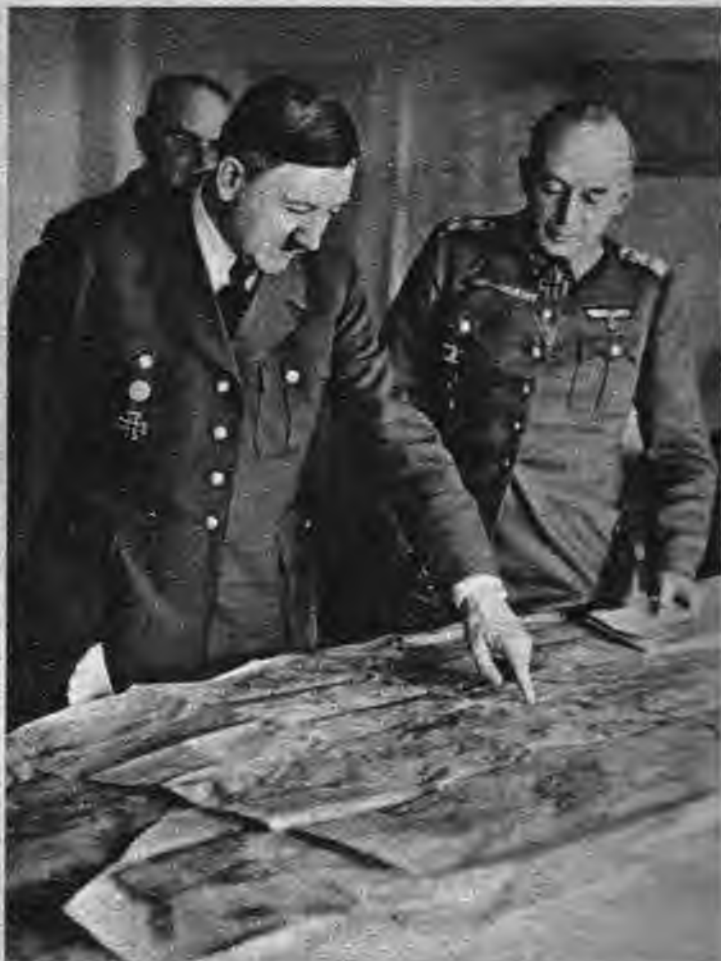
Vadonis kādā militāra stāvokļa apspriedē ar ģenerālpulkvedi Ruofu (Ruoff).