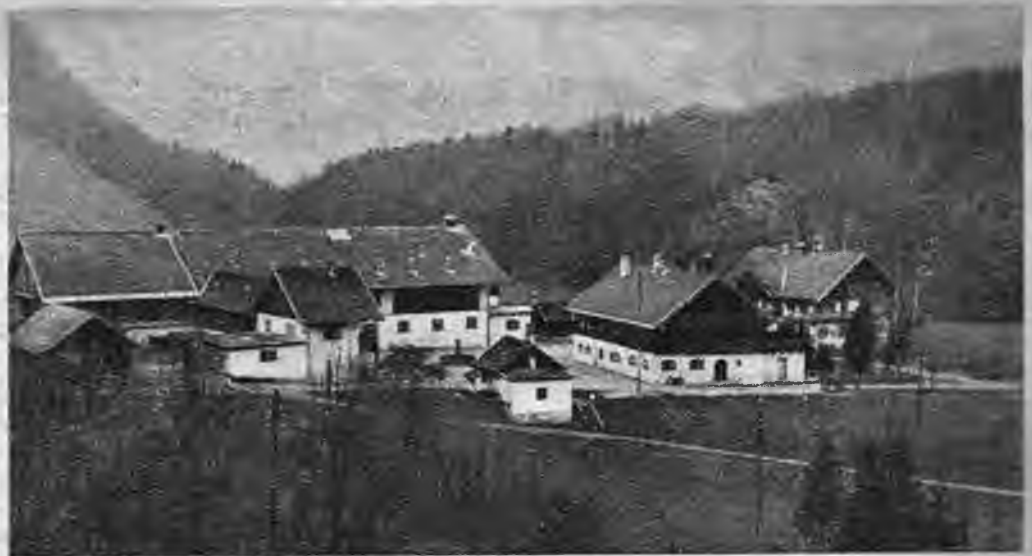
Kuchelbachas mācības ferma kalnos pie Zaiburgas, kur sagatavo lielāku saimniecību vadītājus.

Zemnieka lielā paļīga — darba zirga kārtīga sukāšana ir īkpat avariģa kā pareiza barošana