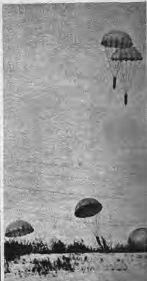
Kaņģavīrs māj lidotājam ar tukšu benzīna kantu, norādīdams vietu, kur nometami izplētņi ar pilnajām benzīna tvertnēm. Lūk, apgādes bumbas jau krit! Tās savāc vienkopus, atvēr bumbas uzgaļi, pie kuņģa paliek izplētņi, un saņem piegādātās mantas.