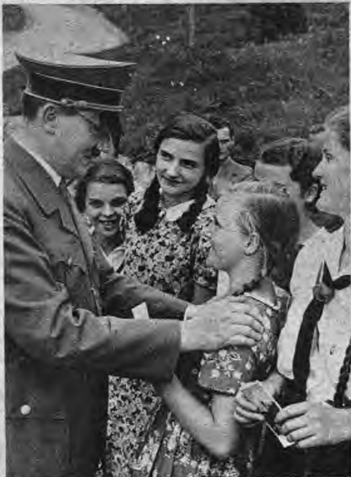
Adolfs Hitlers savas jaunatnes vidū.

pilnīgo uzticību un pašātvību Adolfs Hitlers nav ieguvis vienā dienā, bet 18 gadu ilgā darbībā — modinot, kopojo un stiprinot tautas spēku pacilātas vienības un cēlu ideju apdvēstas kopības garā.