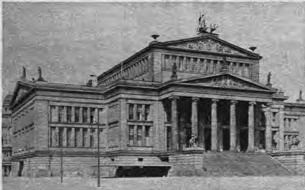
Valsts dramatiskais teātris pie Zandarmenmarkta Berlinē ir nevien monumentāla, bet arī skaista celtnē. Teātra izrāžu mākslinieciskais līmenis ir visai augsts.

devumi skatuves mākslai un tās lielākai sāpencei — filmai ir nacionālsociālistiskā Lielvācijā. Tagad pēc spriega darba dienām, kad visiem sevišķi nepieciešama atpūta un izklaidēšanās, teātris, opera, balets, filma to sniedz vēl jo lielākā mērā, dodot jaunus spēkus dzīvei un darbam. Labākie skatuves mākslas un filmu aktieři, spējīgi režisori, apdāvināti komponisti gādā par vērtīgu mākslas darbu atdzīvināšanu. Vācu teātra mākslas līmenis jāuzskata par sevišķi augstu.