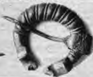
Pakavsakta ar zvērgalvu galiem.