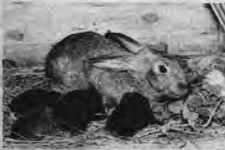
Truŗu māte ar pavasara pirmā metiena mazuļiem.