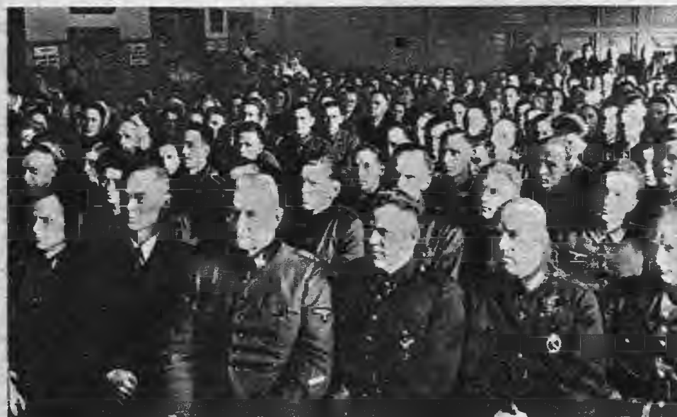
Aino skatītāju zālē: kaŗavīru un fabrikas darba saimes vidū (no kreisās): pulkv. Silgailis, dir. R. Veidemanis, ģen. Bangerskis; no labās otis — kapt. Mateasa. Kaŗavīru vārdā par laipno uzņemšanu un skais to sarīkojumu pateicās ģen. Bangerskis.