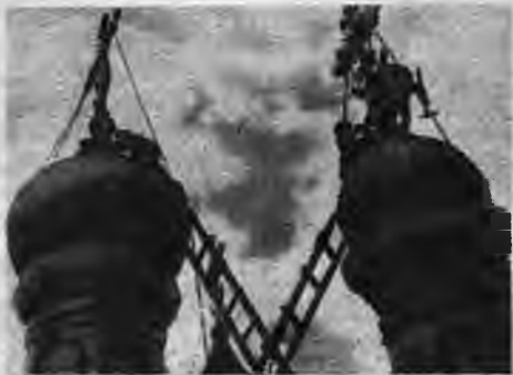
Postot baznīcas, bolševiki liek noņemt krustus no kupoliem. Apgānītās svētnīcas bolševiki pārvērš par kinoteātriem, mūzejiem, sporta zālēm, klubiem, zirgu staļiem u. t. l., pie kam ūidu sinagogas tiek saudzētas.

Visiem zināms, kā bolševiki raugās uz reliģiju un visu to, kas ar to stāv sakarā. Pēc ģīda Marksa un Leņina mācības reliģija ir vai nu opijs tautas iemidzināšanai, vai līdzeklis tautas muļķošanai. Tādēļ tā uzskatāma par kaitīgu un visiem spēkiem iznīcināma.