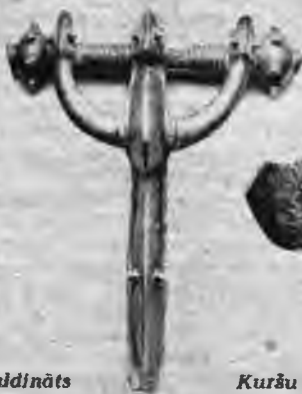
Kuršu sudraba sakta ar zvērgalvu rotājumu atdarinājumu.