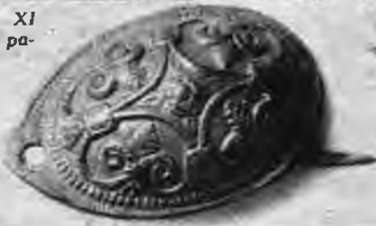
Libiešu brūnūrupuča sakta.