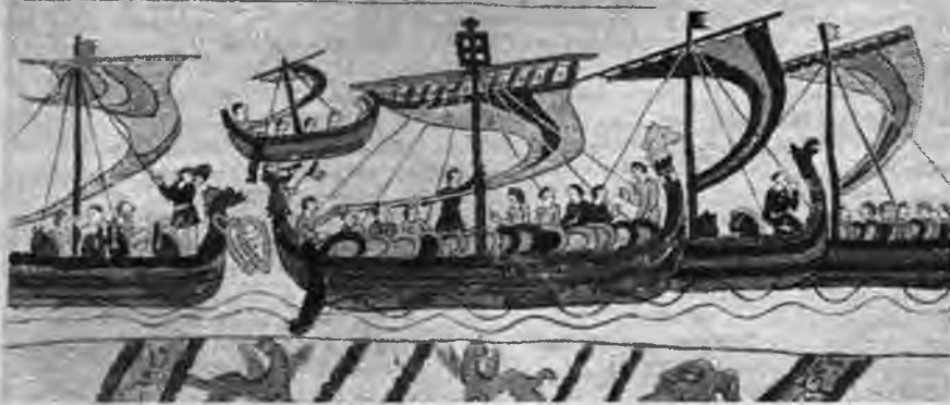
Vikingu kuģi XI g. s. „Bayeux” paklāja attēli.