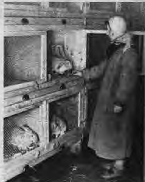
Skats truŗu mājā, kur telpas taupības nolūkos krātiņi novietoti trijos stāvos.

Truŗu audzēšanu uzsākot, vispirms jāizŗķirŗas, kādus truŗus audzēt — vilnas, ādiņu vai gaŗas truŗus, pie kam visos gadījumos jānod priekŗroka ne krustojumiem, bet tīras sugas truŗiem. Saimnieciskā ziņā par izdevīgāko uzskata balto angoras truŗi, kas dod 350—400 gr. vilnas gadā, bet gaŗas gandrīz tikpat daudz kā citu sugu truŗi. Tikai angoras truŗis prasa rūpīgāku kopŗšanu. Vērtīgāks ādas dod sudrabpelēkie šinŗilas truŗi, kas pieauguŗi dod arī ne mazāk par