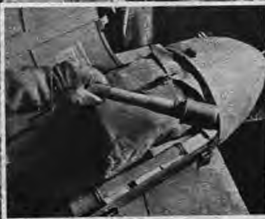
Kaņģavīriem prieks par apgādes bumbu. Šīs bumbas satur — rokas granātas un municija.

cēju palīdzību ir tikai viens, bet neapbāmi — ļoti īpatnējs gaisa un zemes bruņoto spēku sadarbības un izpalīdzības veids. To izlieto visur, kur apgāde ļoti steidzama vai arī pa zemes ceļu nav iespējama. Apgādes bumbas bieži vien piegādājamas priekšējo trieciengrupu tankiem pat bēniņos, bet municijas un pārtikas piegāde tādā veidā gluži parasta parādība kā austrumu frontes sniega laukos, tā Afrikas tuksnešos. Lieliskā sadarbība starp atsevišķām ierocē šķirām un labais sakaru dienests ir tas, kas vācu bruņotiem spēkiem sniedz nesalīdzināmas priekārocības visos kaujas laukos.